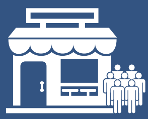
Salón de Té "Buenos Aires"

Contar con carnet de sanidad para las personas que atiendan al público y/o manipulen alimentos.